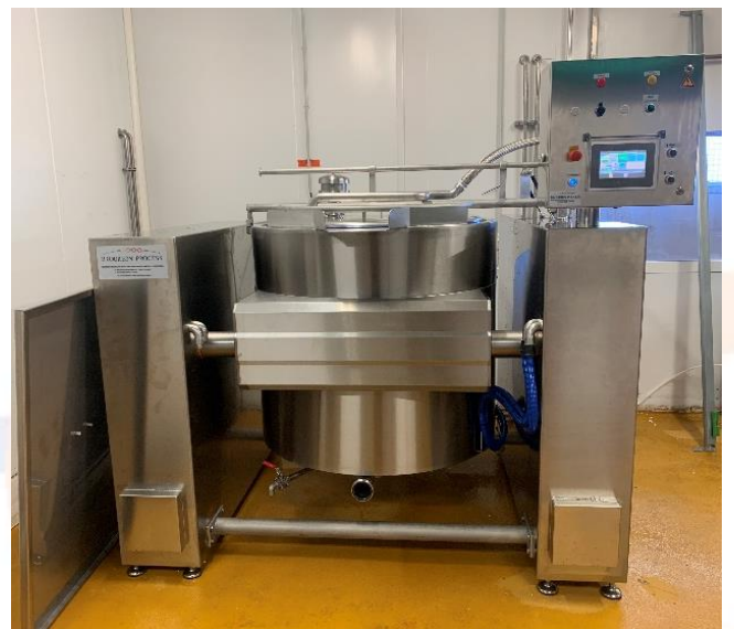
Turbine / Mixeur pendulaire