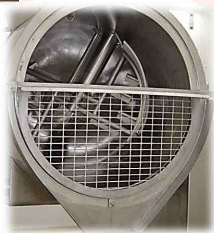
Turbine de Broyage