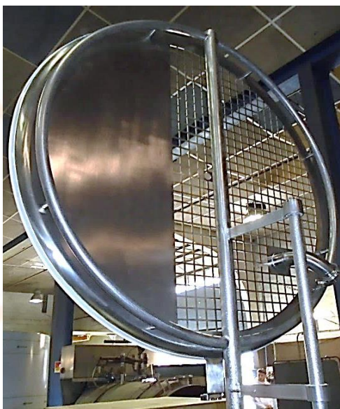
FIXES, AMOVIBLES, Avec Relevages Assistés, ...