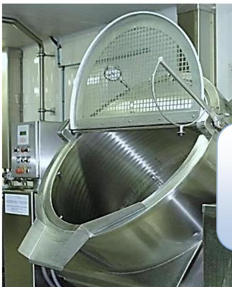
COUVERTRES PLEIN Ajouré Pour Autocuiseur avec Hublot éclairant